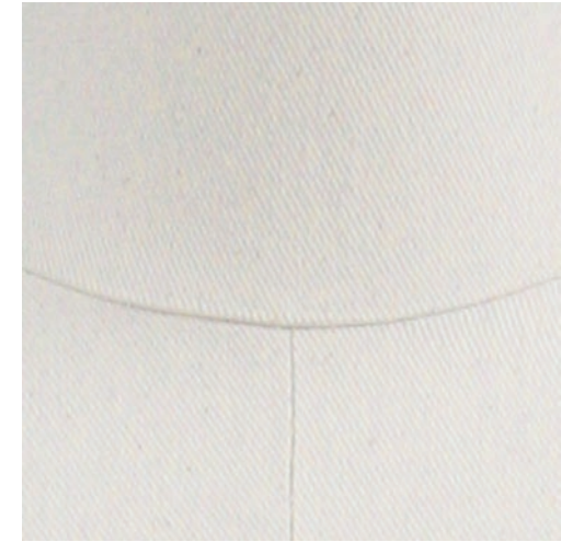
カツラギ (張り生地) ツイルのデニムよりやや薄く ナチュラルでシルク印刷にも 映える素材。 ユーズドやヴィンテージ感に。