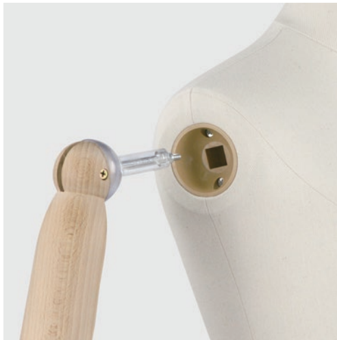
サイドジョイントシステム 従来の肩ジョイント構造と違い 横から挿入するタイプ。