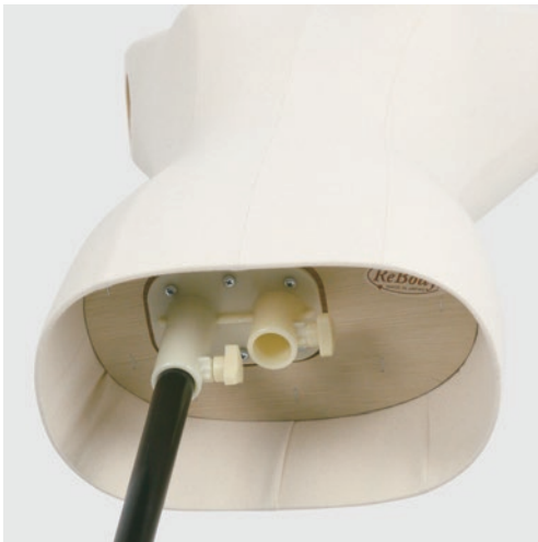
デュアルシステム デュアルタイプボディは フランジ (パイプ受け) が2箇所仕様。 使用位置に応じてスラックスを履かせる ことが出来る兼用タイプ構造。