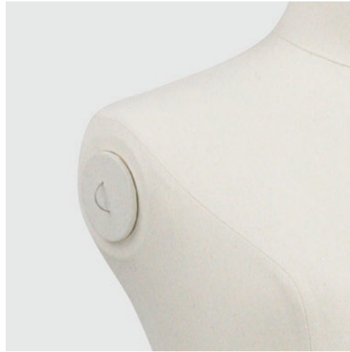
ショルダーカバー SK0031KA (カツラギ) SK0031C (芯地) 腕を外して使用する際に ジョイント穴をカバー。