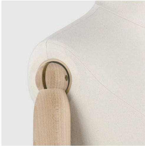
ショルダーライン 本来のボディラインを崩さない 新しいジョイント構造。